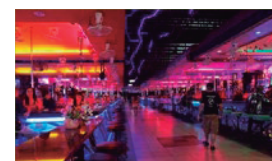
Lugares de entretenimiento